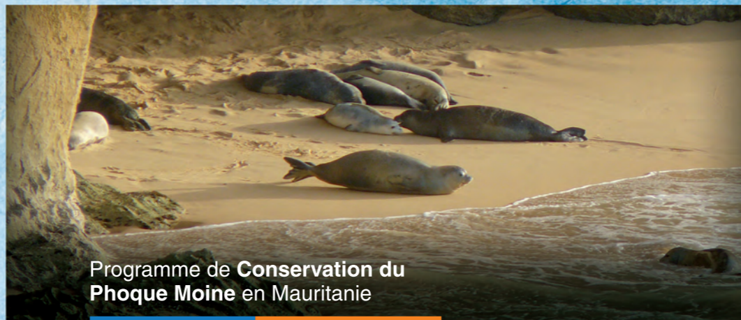
Programme de Conservation du Phoque Moine en Mauritanie

Fondation CBD-Habitat C/ Gustavo Fernández Balbuena, n° 2 28002 Madrid · ESPAGNE